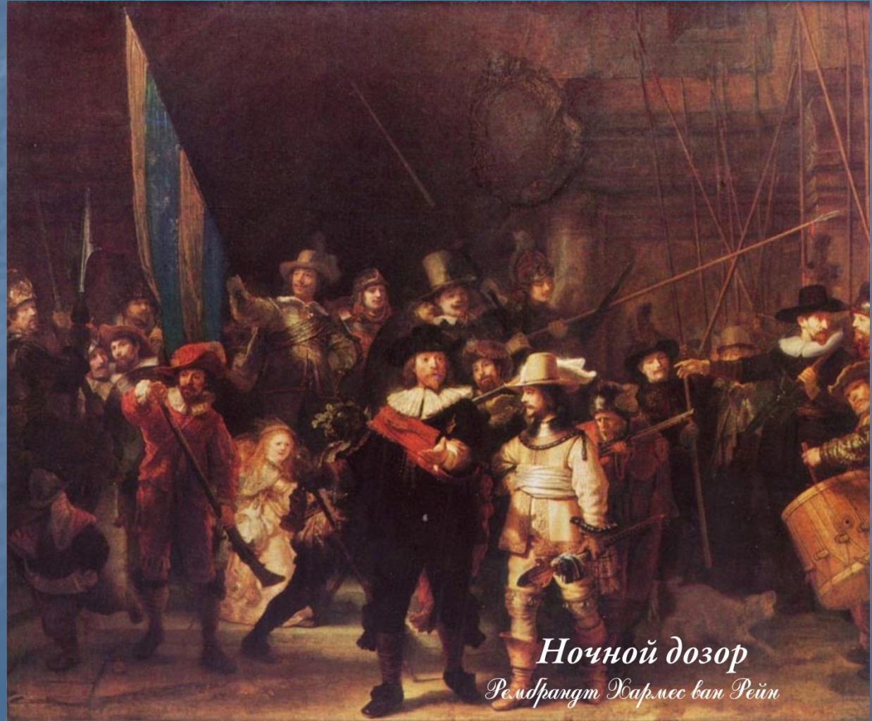
Ночной дозор Рембрандт Хармес ван Рейн