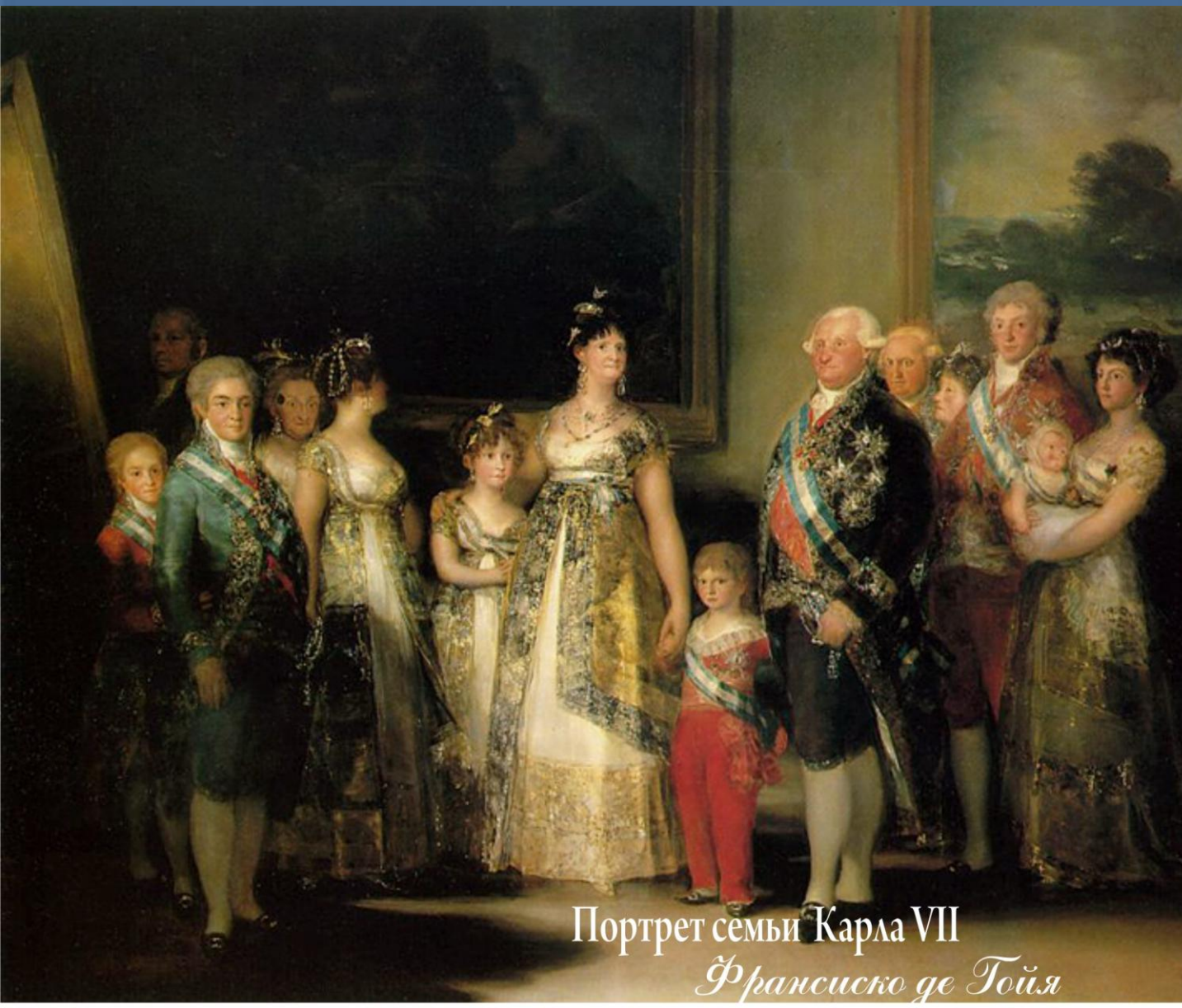
Портрет семьи Карла VII Франсиско де Гойя