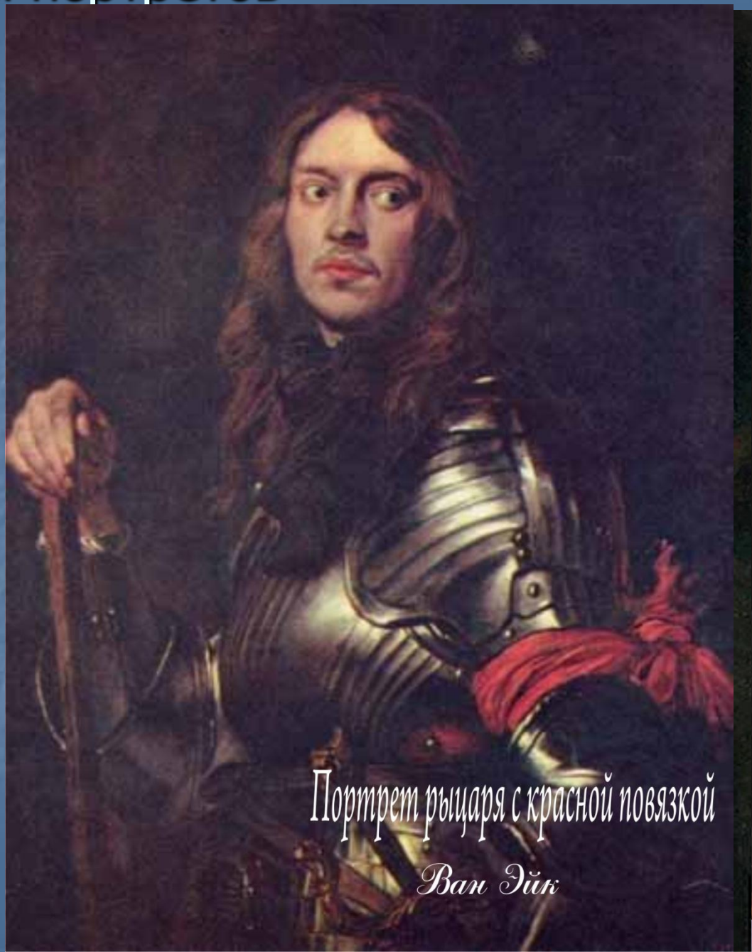
Портрет рыцаря с красной повязкой