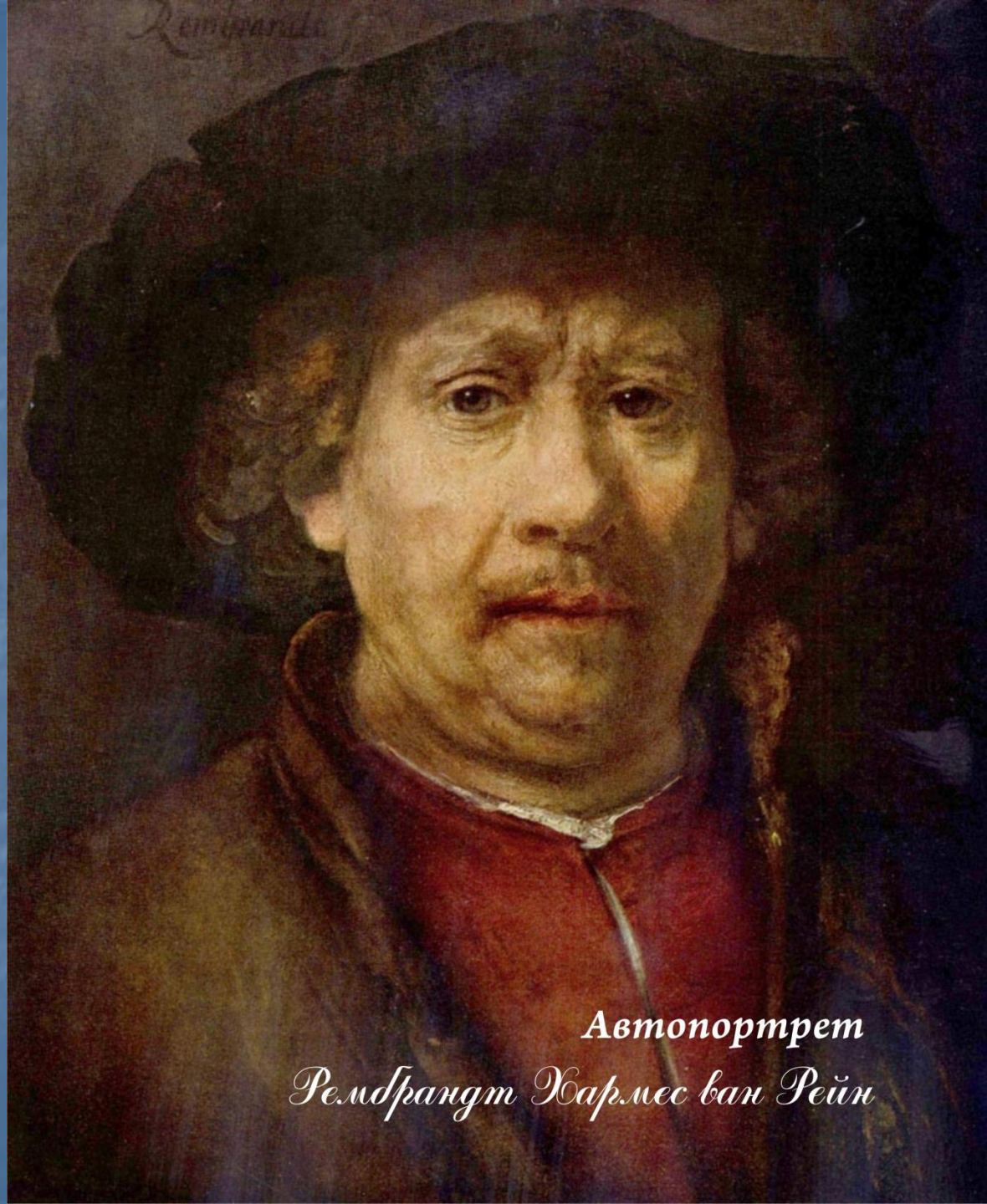
Автопортрет Рембрандт Хармес ван Рейн