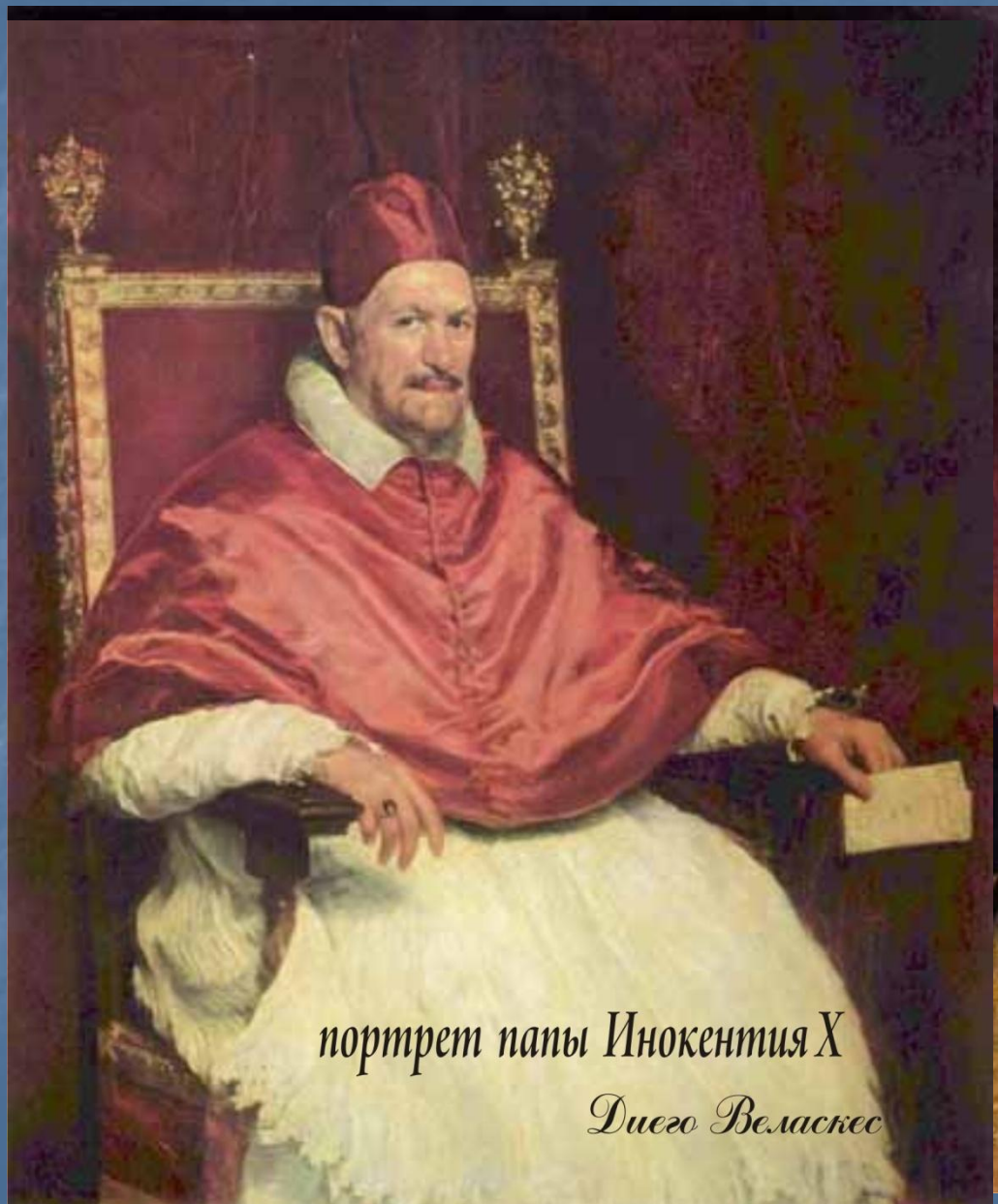
портрет папы Иннокентия X