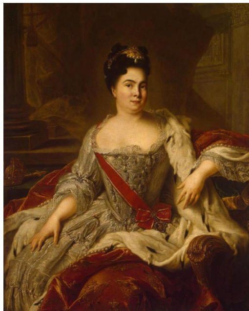
Жан-Марк Натье Портрет Екатерины I

Исторический портрет — изображает какого-либо деятеля прошлого и создаваемого по воспоминаниям или воображению мастера, на основе вспомогательного (литературно-художественного, документального и т. п.) материала. В сочетании портрета с бытовым или историческим жанром модель часто вступает во взаимодействие с вымышленными персонажами.