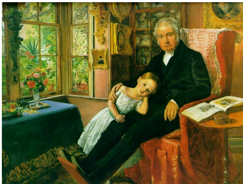
Э. Милле Портрет Уайетта

Портрет-картина — портретируемый представлен в смысловой и сюжетной взаимосвязи с окружающими его миром вещей, природой, архитектурными мотивами и другими людьми (последнее — групповой портрет-картина).