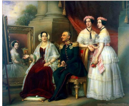
Йозеф Карл Штилер "Групповой портрет семьи герцога Йозефа Саксен"

Индивидуальный портрет- портрет, включающий одного персонажа.