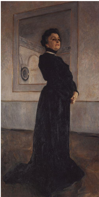
В. Серов Портрет, Артистки, М.Н. Ермоловой

Групповой портрет - портрет, включающий не менее трех персонажей.