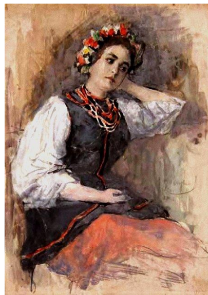
Александр Вахрамеев Фигура девушки

Костюмированный портрет- портрет, в котором человек представлен в виде аллегорического, мифологического, исторического, театрального или литературного персонажа. Обычно в наименования таких портретов включаются слова "в виде" или "в образе".