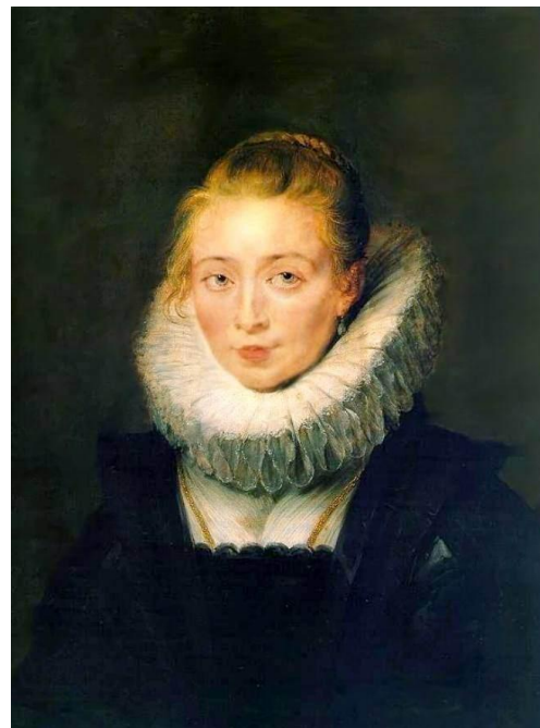
Б. Рубенс Портрет Изабеллы

Камерный портрет - портрет, использующий поясное, погрудное или поплечное изображение человека. Обычно в камерном портрете фигура дается на нейтральном фоне.