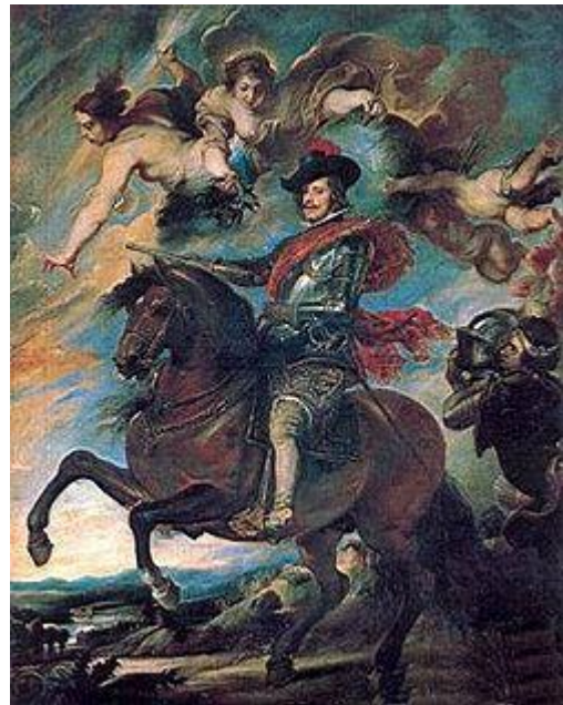
Диего Веласкес копия оригинала Рубенса

Парадный портрет - портрет, который, как правило, предполагает показ человека в полный рост (на коне, стоящим или сидящим). В парадном портрете фигура обычно даётся на архитектурном или пейзажном фоне; большая проработанность делает его близким к повествовательной картине, что подразумевает не только внушительные размеры, но и индивидуальный образный строй. В зависимости от атрибутов парадный портрет бывает: коронационный (реже встречается тронный), конный, в образе полководца (военный). Охотничий портрет примыкает к парадному, но может быть и камерным.