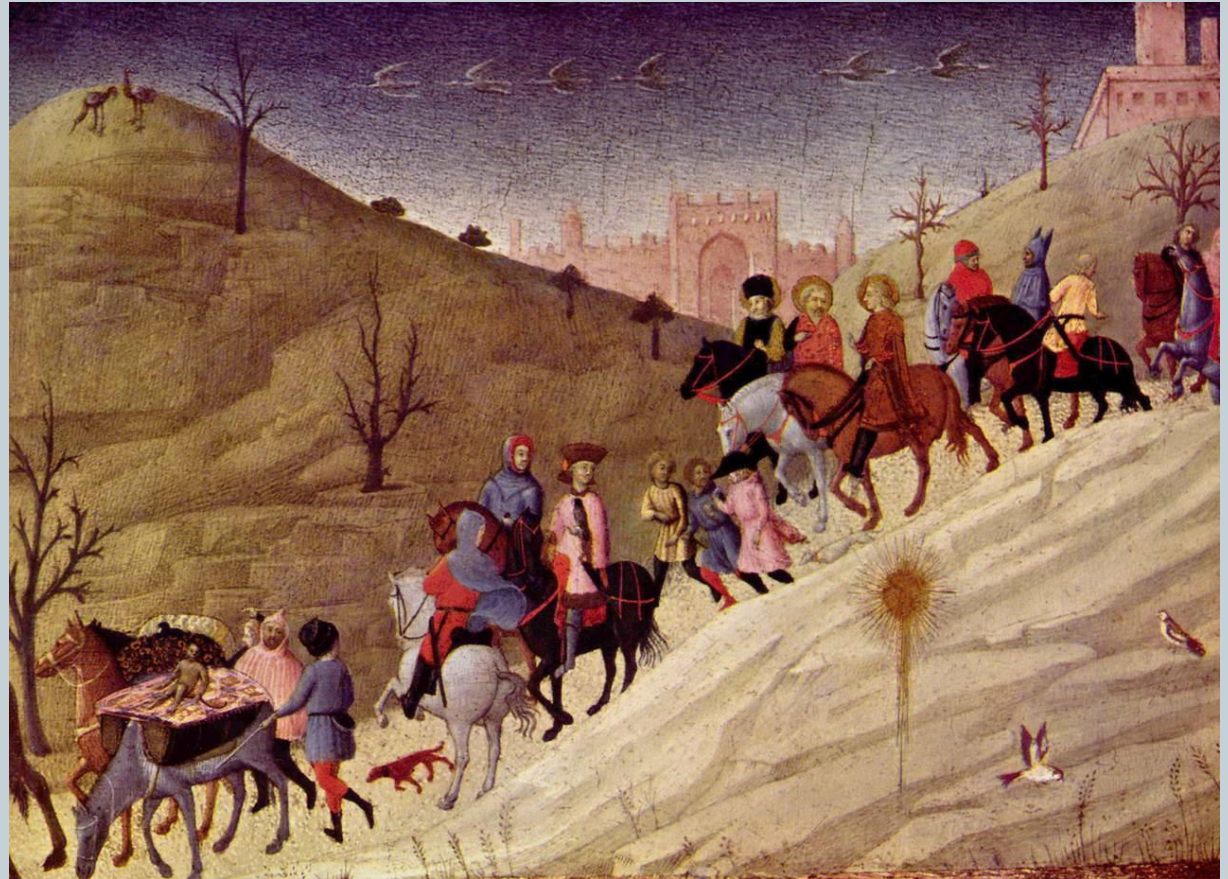
Стефано ди Джованни, «Шествие волхвов», I пол. XV века.

Примером такой картины является полотно итальянского живописца Стефано ди Джованни, также известного по прозвищу Сасетта – «Шествие волхвов» (I пол. XV века).