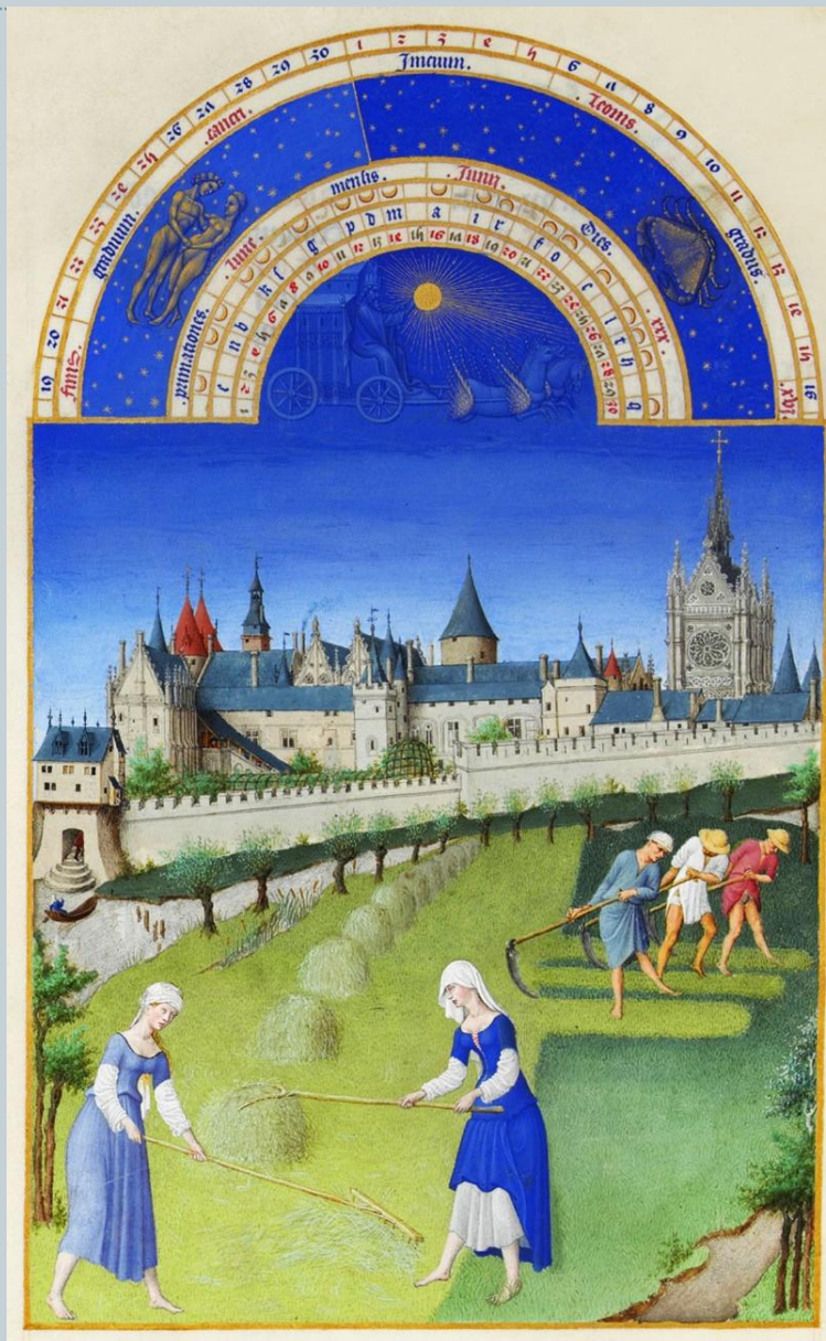
Братья Лимбург, "Часослов герцога Беррийского".

Немаловажное значение в становлении пейзажной живописи имеют миниатюристы. Во Франции при дворах герцогов Беррийских и Бургундских в 1410-х годах творили талантливые иллюстраторы – братья Лимбург, которые создали ряд миниатюр к часослову герцога Беррийского. Это красочные и изящные рисунки, повествующие о временах года и, соответственно - полевых работах, а также развлечениях, демонстрируют зрителям природные ландшафты, которые были выполнены с высочайшим для того времени уровнем передачи перспективы.