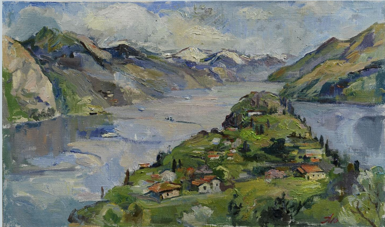
М. Иванова-Очерет, "Мыс на озере Комо"

Пейзажная живопись очень изменилась, пройдя путь почти в 9 тыс. лет. Она трансформировалась из простого наскального рисунка в полотна великих мастеров, которые ничуть не уступают действительности. Тем не менее, искусство не замирает в одной точке, а продолжает развиваться. И современные художники в XXI веке также обращаются в своих работах к пейзажному жанру.