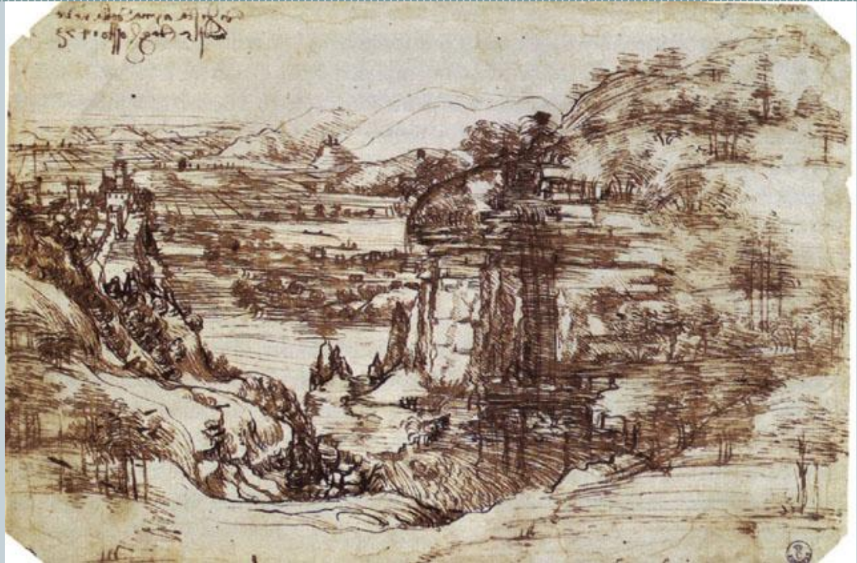
Леонардо да Винчи

Несмотря на очевидный скачок в развитии пейзажа, вплоть до XVI века художники использовали пейзажные мотивы лишь в качестве фонового пространства в жанровой картине, классической религиозной сцене, или же портрете.