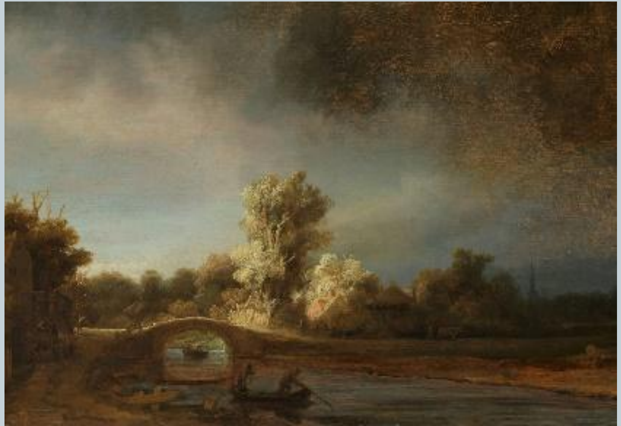
Харменс ван Рейн Рембрандт.

Сформировалась голландская и фламандская школы живописи – пейзаж занял особое место в работах художников. Свой вклад в развитие жанра сделали Пуссен, Лоррен, Рубенс.