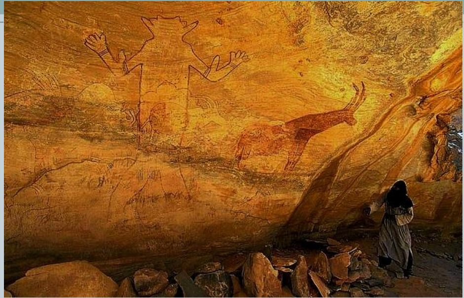
Плато Тассилин-Аджер в Сахаре 7 тыс. до н.э.

Также пейзажный мотив, как элемент настенной росписи, довольно часто встречается в гробницах правителей Древнего Египта.