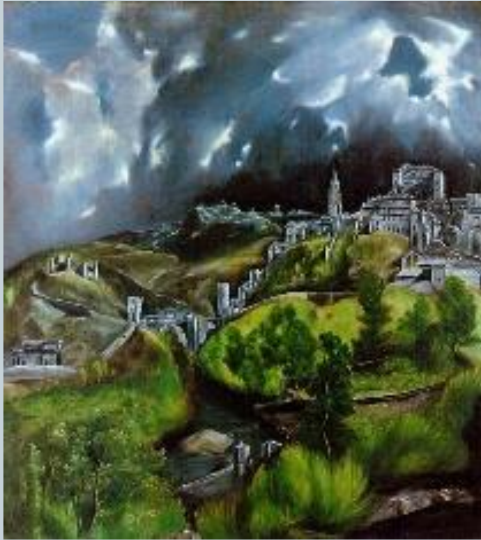
Эль Греко «Вид Толедо»

В XVI веке увлечение европейцев феноменом пространства послужило мощным стимулом развития пейзажа. Потрясающий пространственный размах, скомпонованные тысячекилометровые расстояния, доступные лишь мысленному представлению - позднее их назовут «пейзажи — энциклопедии».