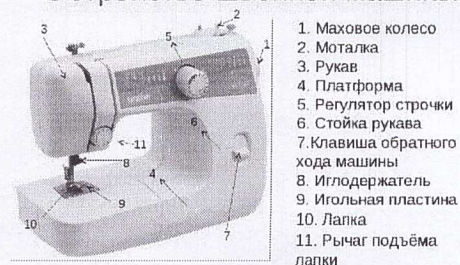
Устройство швейной машины

Практическая часть оценивания критерия: педагог отслеживает насколько аккуратно и быстро ребенок осваивает работу за швейной машиной, правильно ли сидит